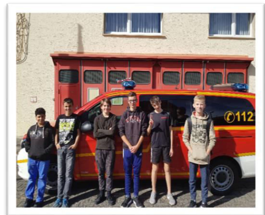
Text und Foto: Sebastian Flohr

Die „Feuerwehr AG“ möchte den Teilnehmern feuerwehrspezifisches Wissen vermitteln, aber auch Zusammenhalt und Vorteile eine Gruppe aufzeigen. So lernen sie das richtige Verhalten im Brandfall, die Voraussetzungen, welche für die Entstehung eines Feuers gegeben sein müssen, das richtige Löschverfahren und noch vieles mehr!